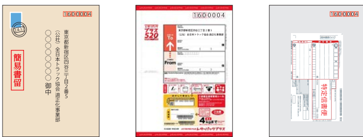
一般書留郵便 簡易書留郵便