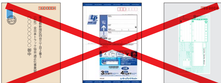
普通郵便 特定記録郵便