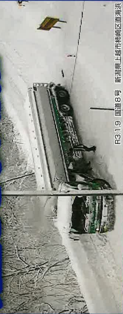
R3.1.9 国道8号 新潟県上越市柿崎区直海浜