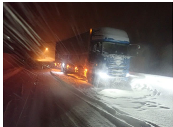
車両のスタック状況(R3年12月18日:国道17号三国峠)