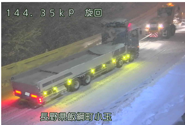
スタック車両の牽引状況(R3年12月17日:国道18号飯綱町)