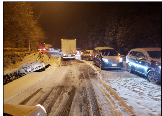
国道1号箱根新道(平成31年3月)