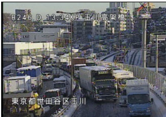
国道246号東京都世田谷区(平成30年1月)

過去の南岸低気圧に伴う関東地方での大雪の際は、スタック車両に伴う滞留が多く発生しています。