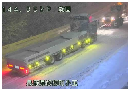
国道18号【長野県飯綱町】 スタック車両の牽引状況(令和3年12月)