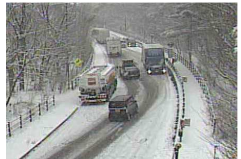
国道139号 籠坂峠【山梨県富士河口湖町】 大型車スタック状況(令和4年1月)