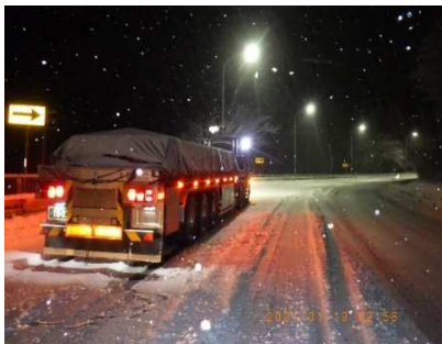
国道18号【群馬県安中市松井田町】 大型車スタック状況(令和4年1月)

■大型車は冬用タイヤを装着していてもスタックが発生しています。チェーンの装着をお願いします。