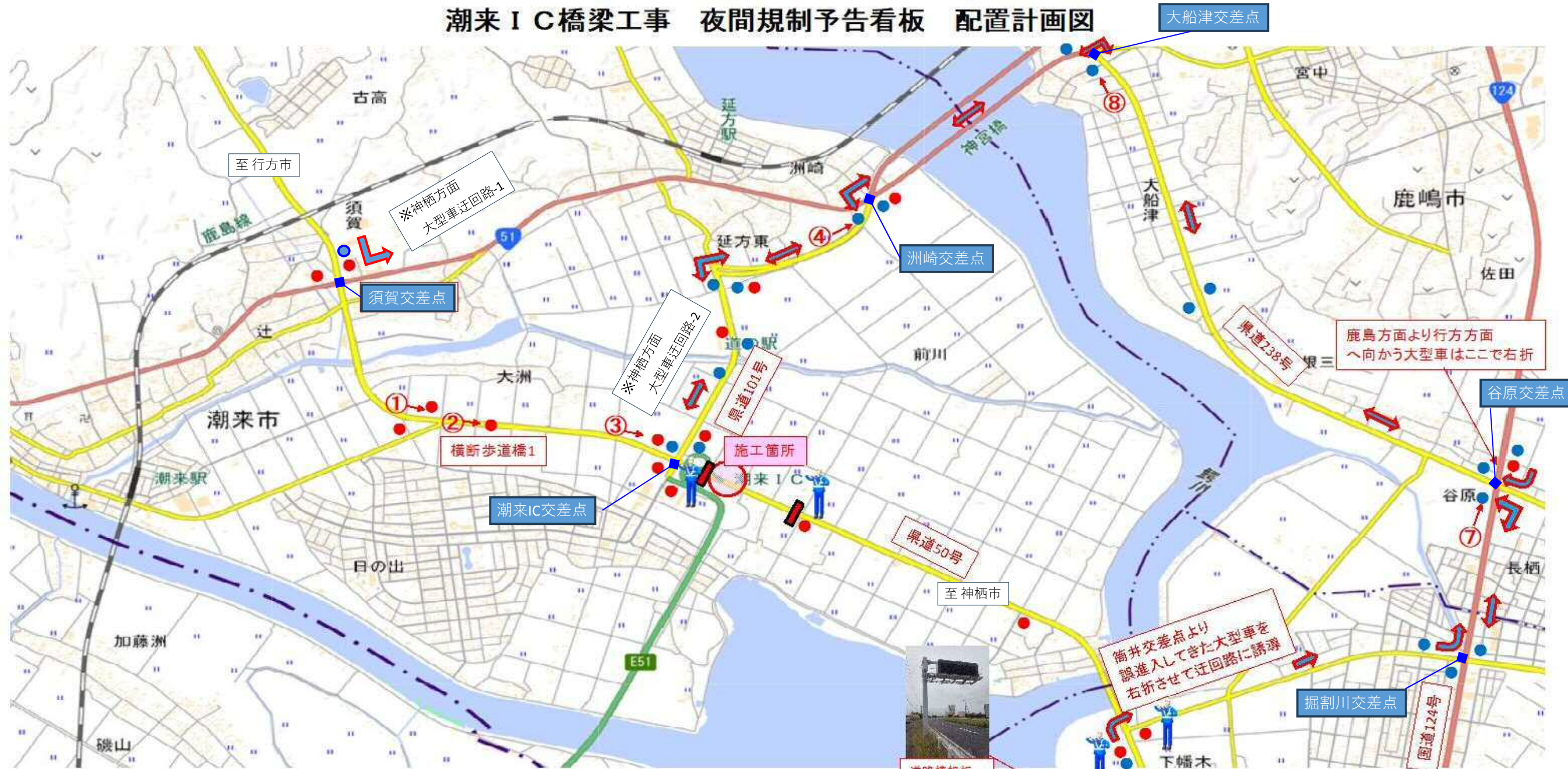
● 夜間規制予告看板(例)