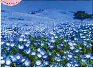
ひたち海浜公園・ネモフィラの丘