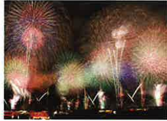
土浦全国花火競技大会