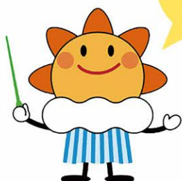
気象庁マスコットキャラクターはれるん